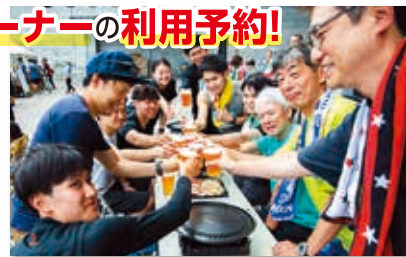
※画像は全てイメージです。